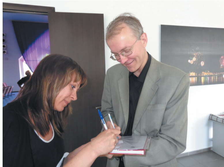
Семинар в Чебоксарах. Обмен информацией.

3. В главу 6 ЖК РФ дополнительно внести следующее: - придомовая территория