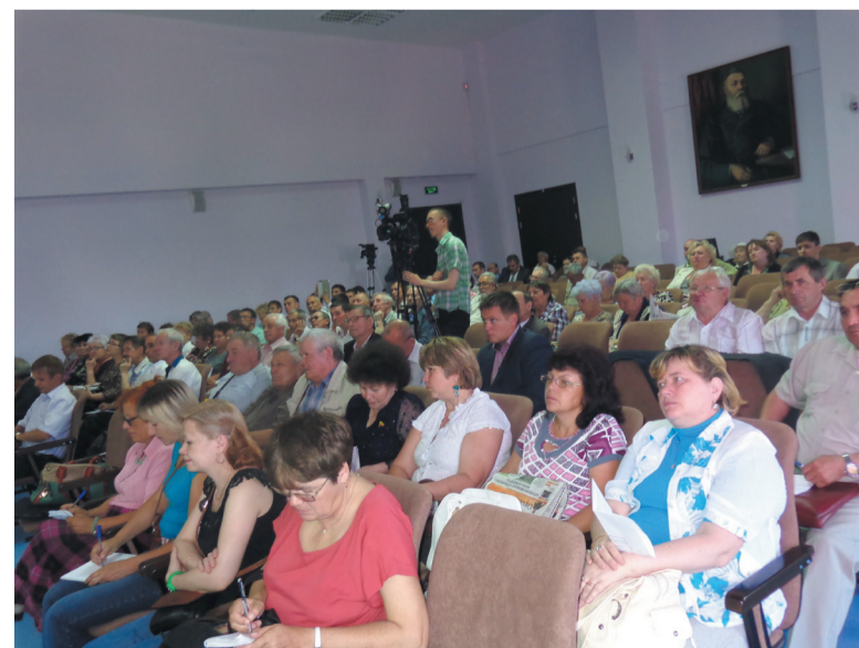
Участники семинара в Чебоксарах.

- общее собрание вправе изменить способ управления своим многоквартирным домом на непосредственное только при наличии заключения специальной технической комиссии о состоянии несущей конструкции и технологических систем и узлов дома, а также при обосновании возможности управления техническими системами и контроля за конструкциями со стороны специалистов в целях безопасности всех собственников.