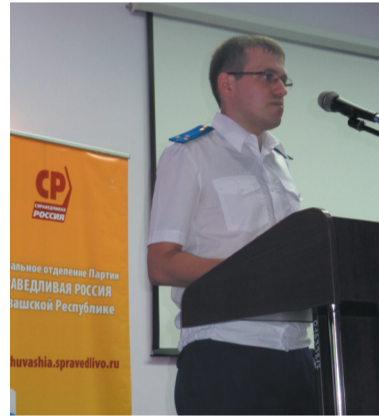
Представитель прокуратуры высказал тревогу по поводу отсутствия контроля за деятельностью ЖКХ на уровне муниципалитетов

Положение дел ЖКХ в регионах характеризуется практически одинаковыми проблемами. По всей стране работает один и тот же механизм выкачивания денег из населения, используются одни и те же методы обмана. Несмотря на то, что принимаются какие-то решения, ситуация меняется очень медленно.