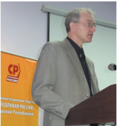
Выступает Олег Шеин – автор книги «Как отстоять свой дом без оружия» и многих других методических материалов для россиян

Среди приглашённых были представители от других политических партий регионов Поволжья, региональные общественные организации «Союз защиты прав собственников и нанимателей жилья», представители прокуратуры, а также в работе семинара-совещания принял участие один из ведущих специалистов России в сфере ЖКХ Олег Шеин – автор известной в стране книги «Как отстоять свой дом без оружия?».