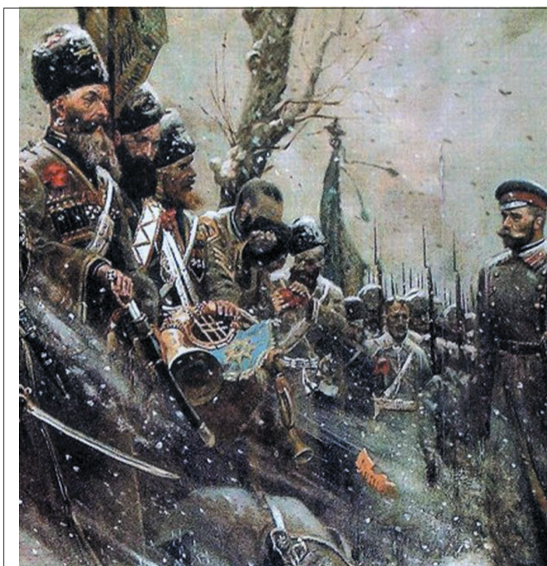
Прощание Государя с войсками, 1917 г. Художник – Павел РЫЖЕНКО

не смог достичь минимальной проектной скорости в 20 узлов. Крейсер принадлежал к несурзному классу кораблей, обладавших избыточной боевой мощью для уничтожения небронированных кораблей торгового флота. При первых же ходовых испытаниях «Аврора» едва не затонула из-за низкого качества клёпки