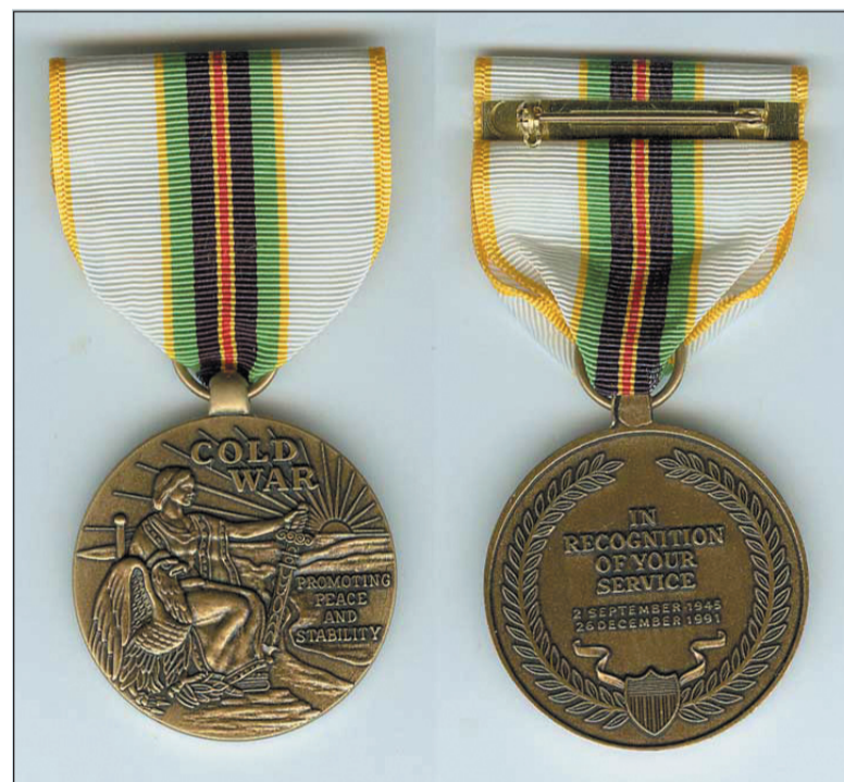
Медаль США «За победу в холодной войне 1945-1991 г.г. Этой медалью также награждались и некоторые граждане России.