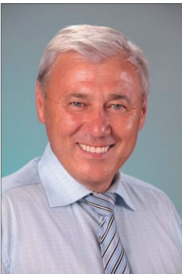
Депутат Государственной Думы Федерального Собрания Российской Федерации Анатолий Геннадьевич АКСАКОВ , фракция СПРАВЕДЛИВАЯ РОССИЯ

22 декабря 2012 г. в Йошкар-Оле прошла конференция по избранию нового Совета Регионального отделения.